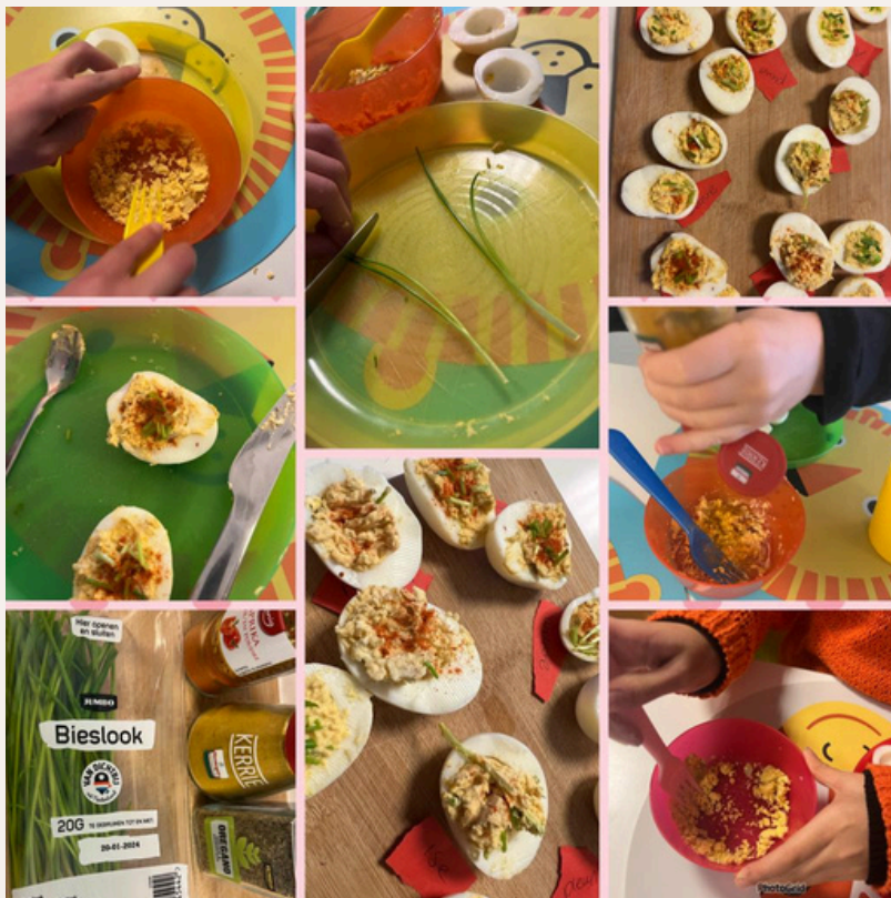
Gevulde eitjes maken!