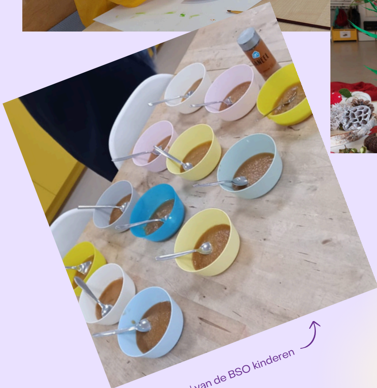
Lekker 'snackje' van de BSO kinderen ↗